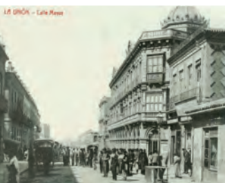
Calle Mayor de La Unión