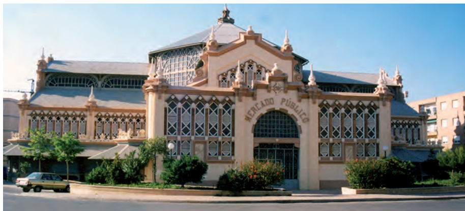
Mercado, fachada posterior.