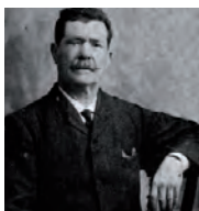
Rojo el Alpargatero

Hacia 1840, apareció por las antiguas Herrerías una importante población de viajeros de fortuna en busca de lo que empezaba a surgir como la fiebre minera. No tardó en darse a conocer como la nueva California, por la riqueza que generaba la explotación de la plata, del plomo y de todos sus recursos naturales.