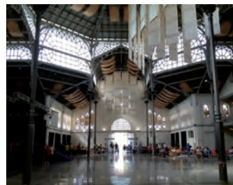
Mercado, vista interior